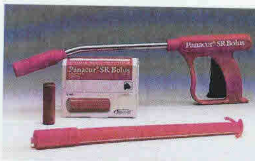
Panacur SR bolus

Bij de Panacur SR bolus wordt een Longwormenting aangeraden . Bij de Repidose bolus is een Longwormenting overbodig .